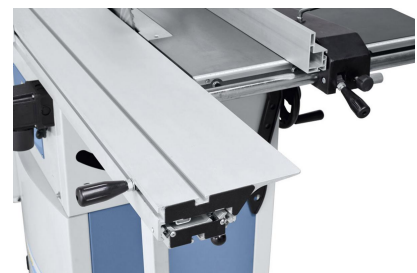
Hoher Bedienkomfort durch den serienmäßigen Formattisch aus eloxiertem Aluminium.