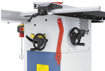
Problemloses bzw. leichtgängiges Verstellen des Sägeaggregates mittels Handräder.