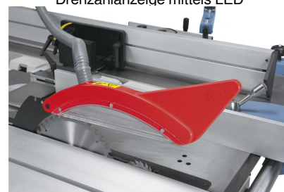
Der Sägeblattschutz mit integriertem Absauganschluss ist am Spaltkeil befestigt. Serienmäßig mit Vorritzaggregat ausgestattet.