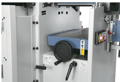
Stabiler Dickentisch aus Grauguss mit mittlerer Zentralführung und Klemmung, zum Hobeln von Werkstücken bis 225 mm Höhe.