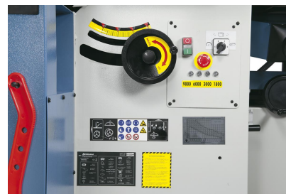
Benutzerfreundliche Schalt- und Bedienelemente, elektronische Drehzahlanzeige mittels LED