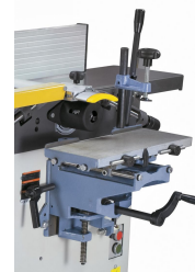
Die Langlochbohrereinrichtung ist ideal für Langlöcher, Dübel- und Schräglochbohrungen