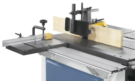
Die solide Fräuserschutzhaube kann für Werkzeuge bis 140 mm Durchmesser verwendet werden.