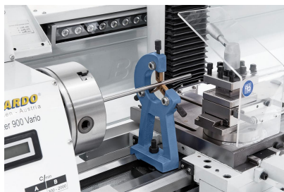
Feststehende Lünette mit Bronzeführung zum Stabilisieren von langen Werkstücken.