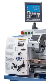
Elektronisch, stufenlose Drehzahlregelung, leichtes Ablesen mittels Digitalanzeige.