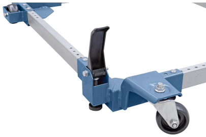
Serienmäßig mit Lenkrollen und Feststellbremse ausgestattet.