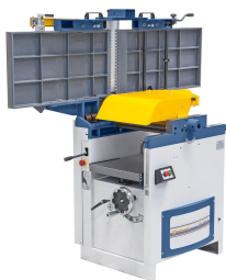
Duales Aufklappen der Abrichttische für maximalen Bedienkomfort.