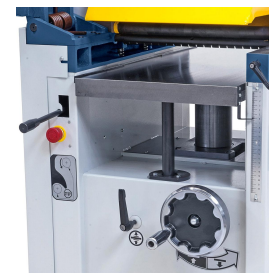
Stabiler Dickentisch mit Pinolenführung und Abstützung für exaktes Hobeln von Bretter, Leisten, Bohlen, ...