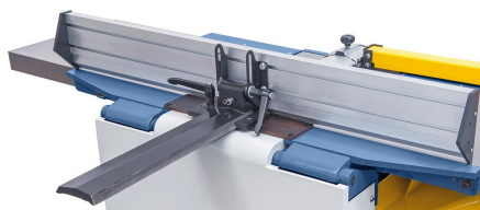
Der Abrichtanschlag wird über eine präzise Prismenführung auf die gewünschte Position eingestellt.