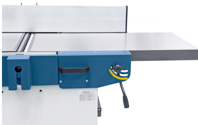
Schnelle und einfache Einstellung der