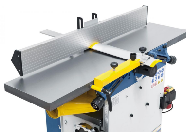
Der lange Abrichtanschlag gewährleistet durch seine große Auflagefläche eine präzise