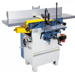
Abbildung mit optional lieferbarer Langlochbohrereinrichtung.