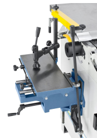
Die optional erhältliche Langlochbohrereinrichtung ist ideal für Langlöcher, Dübel- und Schräglochbohrungen.