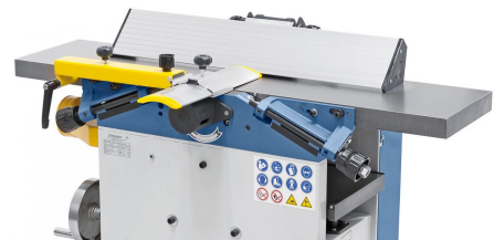
Der massive, bis 45° schrägstellbare Abrichtanschlag mit Prismenführung ist leicht verstellbar.