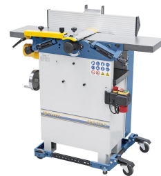
Das optional erhältliche Universalfahrwerk ermöglicht einen leichten Standortwechsel.