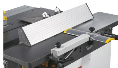
Der massive, bis 45° schrägstellbare Abrichtanschlag mit Prismenführung ist leicht verstellbar.