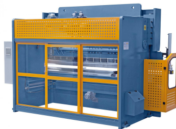
Abbildung AKPL 3200 x 160