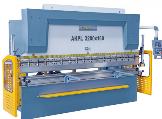
Abbildung AKPL 3200 x 160