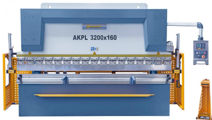
Abbildung AKPL 3200 x 160