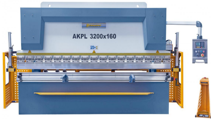
Abbildung AKPL 3200 x 160