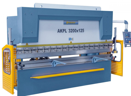
Abbildung AKPL 3200 x 125