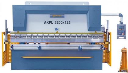
Abbildung AKPL 3200 x 125