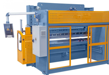
Abbildung AKPL 3200 x 125