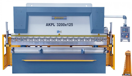
Abbildung AKPL 3200 x 125