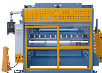
Abbildung AKPL 2500 x 100