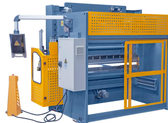
Abbildung AKPL 2500 x 100