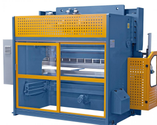
Abbildung AKPL 2500 x 100