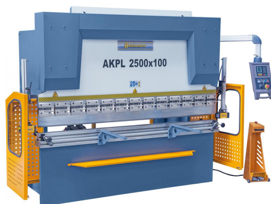
Abbildung AKPL 2500 x 100