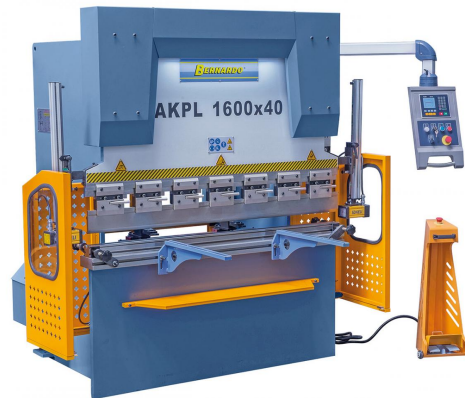
Abbildung AKPL 1600 x 40