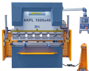
Abbildung AKPL 1600 x 40