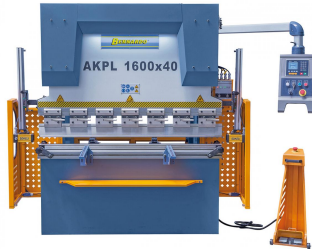
Abbildung AKPL 1600 x 40