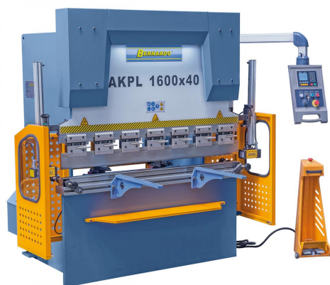
Abbildung AKPL 1600 x 40