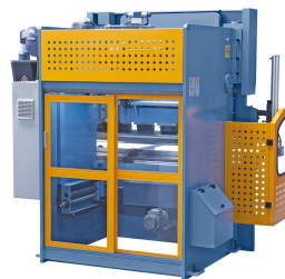
Abbildung AKPL 1600 x 40