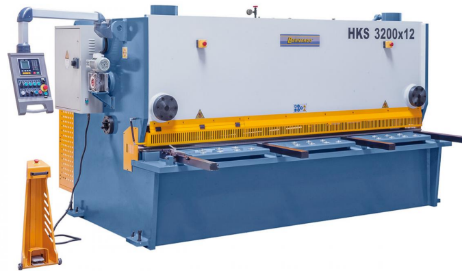
Abbildung HKS 3200 x 12