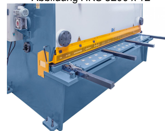
Abbildung HKS 3200 x 12