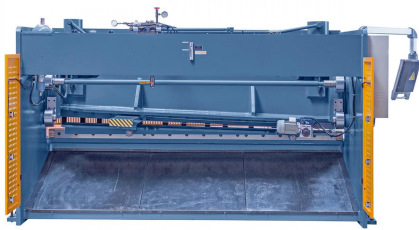
Abbildung HKS 3200 x 12