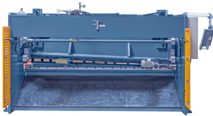
Abbildung HKS 3200 x 12