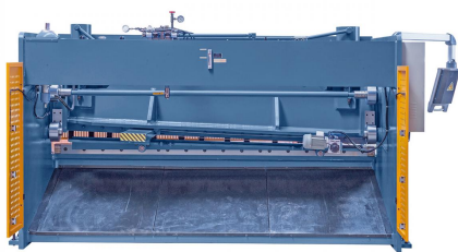
Abbildung HKS 3200 x 12