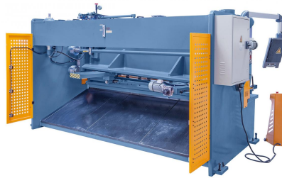
Abbildung HKS 3200 x 12