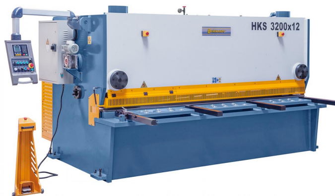
Abbildung HKS 3200 x 12