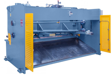
Abbildung HKS 3200 x 12