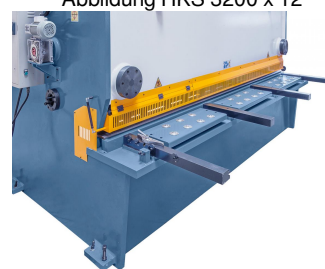
Abbildung HKS 3200 x 12