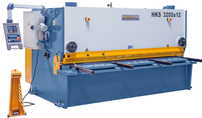
Abbildung HKS 3200 x 12