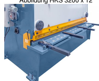
Abbildung HKS 3200 x 12