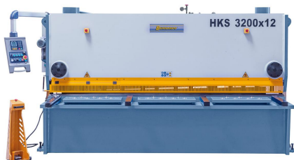
Abbildung HKS 3200 x 12