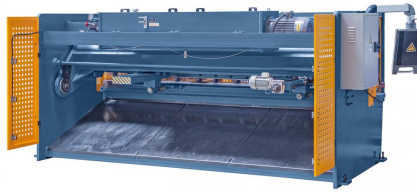
Abbildung HSB 3200 x 6