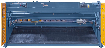
Abbildung HSB 3200 x 6