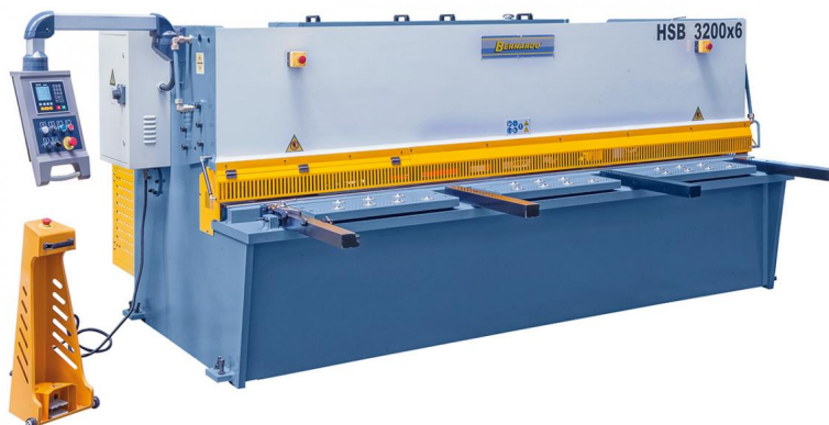
Abbildung HSB 3200 x 6