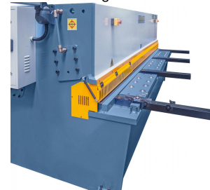
Abbildung HSB 3200 x 6