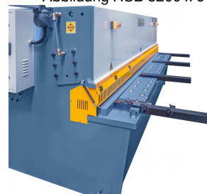
Abbildung HSB 3200 x 6