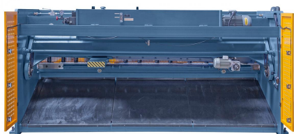
Abbildung HSB 3200 x 6