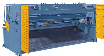
Abbildung HSB 3200 x 6