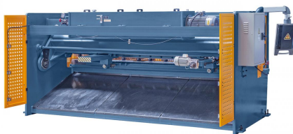
Abbildung HSB 3200 x 6