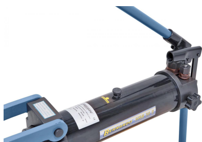
Zylinder mit 2 verschiedenen Geschwindigkeiten