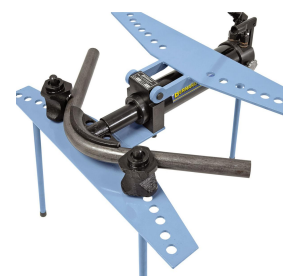
Aufklappbarer Biegerahmen für ein einfaches