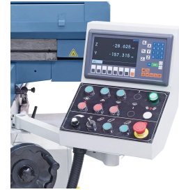
Übersichtliche Anordnung der Schaltelemente am schwenkbaren Bedienpult.