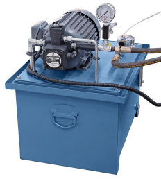
Separate Hydraulikeinheit vermeidet Vibrationen und thermische Belastung