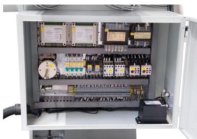
Hochwertige Elektrokomponenten sorgen für einen zuverlässigen Lauf der Maschine.