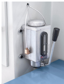
Zentralschmierung für alle Führungsbahnen und Spindeln.