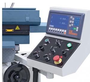
2-Achs-Digitalanzeige mit LCD-Display im Lieferumfang enthalten.