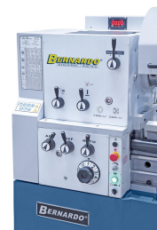
Einfache Bedienung, alle Schalt- und Bedienelemente übersichtlich am Getriebekopf angebracht.