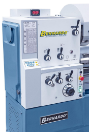
Vorschubgetriebe leicht und präzise schaltbar, geschliffene Zahnräder sorgen für einen ruhigen Lauf.