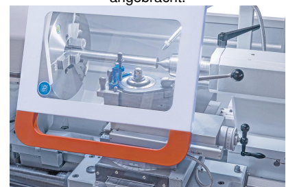
Vorteil des Bernardo-Backenfutters PS3-315 mm / D8: erhöhte Rundlauf-genauigkeit und längere Lebensdauer.