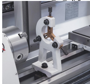
Feststehende Lünette mit Bronzeführung zum Stabilisieren von langen Werkstücken.