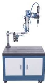
Abbildung TM 12 P / R 1500