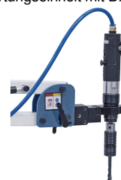
Inklusive Schwenkeinheit zum Horizontal- oder Schrägschneiden.