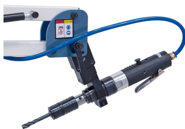
Inklusive Schwenkeinheit zum Horizontal- oder Schrägschneiden.