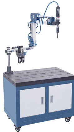
Abbildung TM 12 P / R 1500