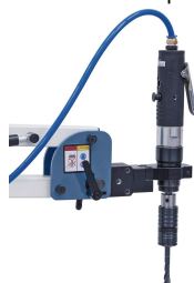
Inklusive Schwenkeinheit zum Horizontal- oder Schrägschneiden.