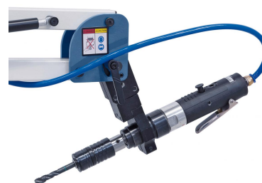
Inklusive Schwenkeinheit zum Horizontal- oder Schrägschneiden.