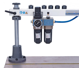
Wartungseinheit mit Druckregler