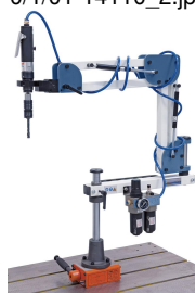
Optional erhältlicher Magnetfuß für den direkten Einsatz an großen und schweren Werkstücken.