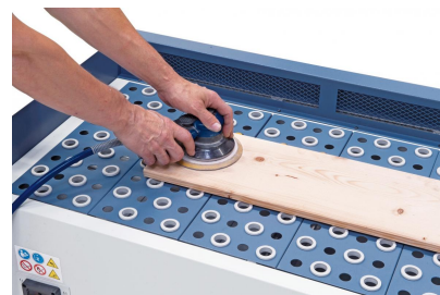
Gummierte Tischauflagen verhindern ein Zerkratzen des Werkstückes.