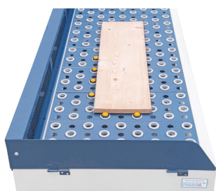
Serienmäßig mit Anschlägen zum Positionieren des Werkstückes.