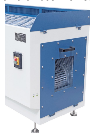
Durch die seitliche Öffnung wird die gefilterte Luft dem Arbeitsraum wieder zugeführt.