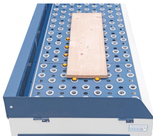
Serienmäßig mit Anschlägen zum Positionieren des Werkstückes.