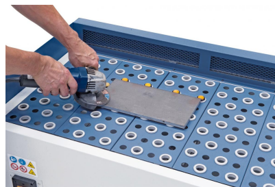
Gummierte Tischauflagen verhindern ein Zerkratzen des Werkstückes.