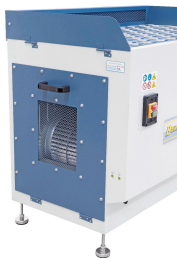
Durch die seitliche Öffnung wird die gefilterte Luft dem Arbeitsraum wieder zugeführt.