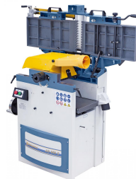
Duales Aufklappen der Abrichttische für maximalen Bedienkomfort.