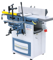
Die Langlochbohrereinrichtung ist ideal für Langlöcher, Dübel- und Schräglochbohrungen,