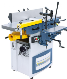
Die Langlochbohrereinrichtung ist ideal für Langlöcher, Dübel- und Schräglochbohrungen,