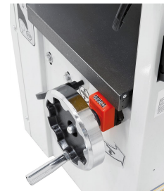
Die Einstellung der Dickentischhöhe erfolgt mittels digitaler Anzeige auf 1/10 mm genau.