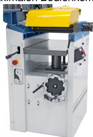
Stabiler Dickentisch mit Pinolenführung und Abstützung für exaktes Hobeln von Bretter, Leisten, Bohlen, ...