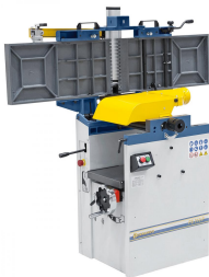
Duales Aufklappen der Abrichttische für maximalen Bedienkomfort.