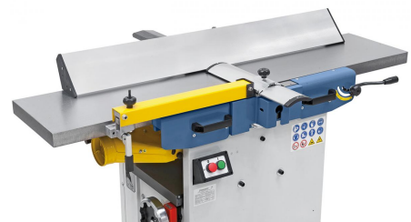
Durch die lange Auflagefläche erlaubt der aus Aluminium bestehende Abrichtanschlag eine Präzisionsbearbeitung von großen und schweren Werkstücken.