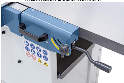
Schnelle und einfache Einstellung der Spanabnahme bis max. 3 mm.