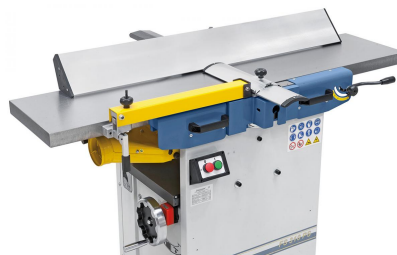
Durch die lange Auflagefläche erlaubt der aus Aluminium bestehende Abrichtanschlag eine Präzisionsbearbeitung von großen und schweren Werkstücken.