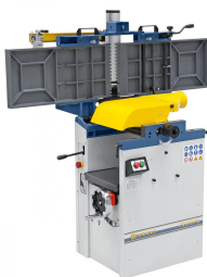
Duales Aufklappen der Abrichttische für maximalen Bedienkomfort.