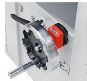
Die Einstellung der Dickentischhöhe erfolgt mittels digitaler Anzeige auf 1/10 mm genau.