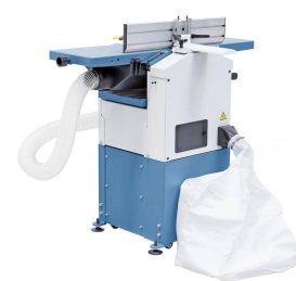
Serienmäßig mit integrierter Späneabsaugung und Filtersack ausgestattet.