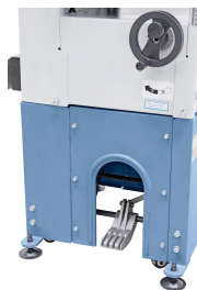
Serienmäßig mit Lenkrollen und Feststellbremse ausgestattet.