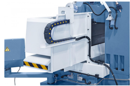
Inklusive Kabelführung über Energiekette.