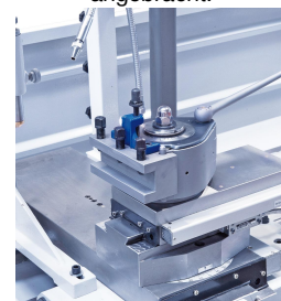
Zum rationellen Arbeiten ist die Maschine serienmäßig mit einem Schnellwechselstahlhalter ausgerüstet.