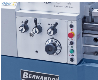
Vorschubgetriebe leicht und präzise schaltbar, geschliffene Zahnräder sorgen für einen ruhigen Lauf.