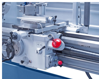
Serienmäßig mit Eilgang zur Reduzierung der Nebenzeiten