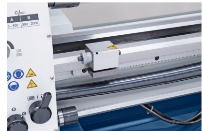
Mikrometerlängsanschlag und Rutschkupplung im Lieferumfang enthalten.