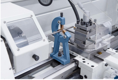
Feststehende Lünette mit Bronzeführung zum Stabilisieren von langen Werkstücken.