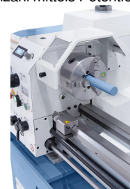
Zum Bearbeiten von großen Wellendurchmessern serienmäßig mit einer 38 mm Spindelbohrung ausgestattet.