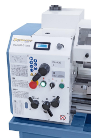
Einfache Vorwahl der Getriebestufe mittels Vorgelege, Einstellen der gewünschten Drehzahl mittels Potentiometer.