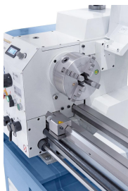
Zentrisch spannendes 4-Backenfutter 160 mm, optimal für Vierkant-Werkstücke (Option).