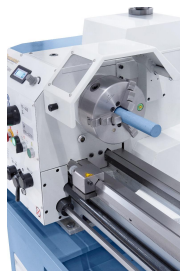
Zum Bearbeiten von großen Wellendurchmessern serienmäßig mit einer 38 mm Spindelbohrung ausgestattet.