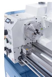
Zentrisch spannendes 4-Backenfutter 160 mm, optimal für Vierkant-Werkstücke (Option).