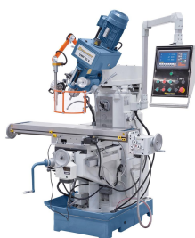
Dreh- und schwenkbarer Fräskopf für universellen Einsatz.