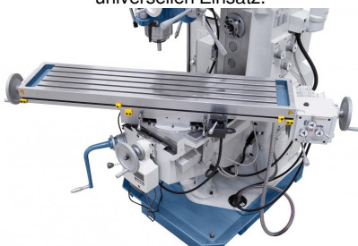
Frästisch von -45° bis +45° schwenkbar.