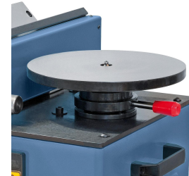
Schnelles Einstellen der Fasenbreite beim Konturfräsen durch Verdrehen des Drehtellers.