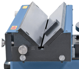
Einfaches Verstellen der Fasenbreite durch verschiebbare Anschlagsschiene.