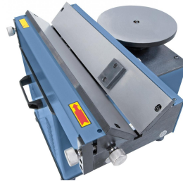
Geschliffene Führungsschiene mit Werkstückanschlag.