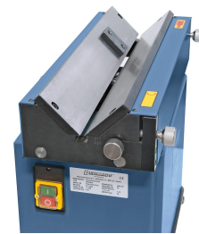
Geschliffene Führungsschiene mit Werkstückanschlag.