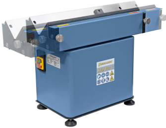
Serienmäßig mit verschiebbarer Führungsschiene.