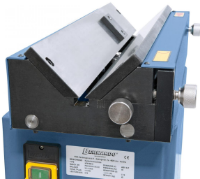
Einfaches Verstellen der Fasenbreite durch verschiebbare Anschlagsschiene.