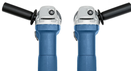
Ergonomischer Handgriff für ermüdungsfreies Arbeiten, wahlweise links oder rechts verwendbar.