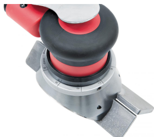
Stufenlose Einstellung der Fasenbreite mittels Skalering.