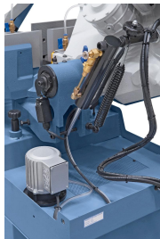
Serienmäßig mit leistungsstarker Kühlmittelpumpe.