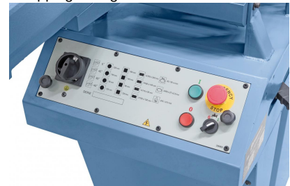
Einfache Bedienung der Schaltelemente am Elektropaneel.