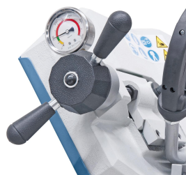
Optimales Einstellen der Sägebandspannung mittels Manometer.