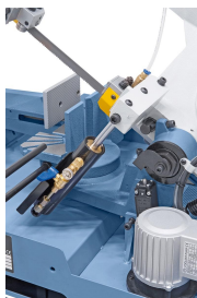
Hydraulikzylinder für stufenloses Absenken des Sägebügels.