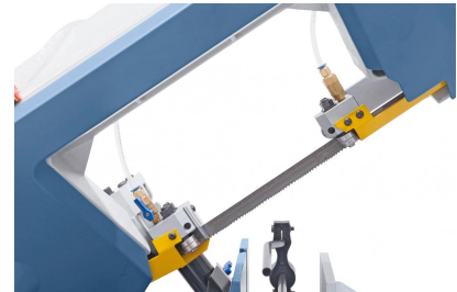
Kugelgelagerte Sägebandführung für präzise Schnitte