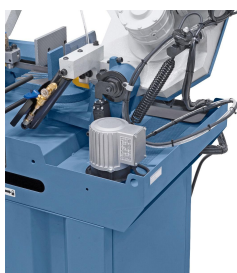
Leistungstarke Kühlmittel-pumpe im Lieferumfang enthalten