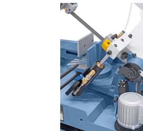
Hydraulikzylinder für stufenloses Absenken des Sägebügels.