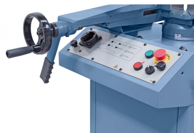
Alle Schaltelemente sind übersichtlich angebracht.