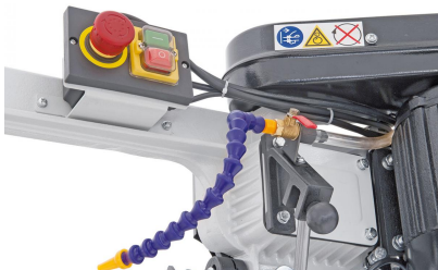
Sicherheitsschalter mit Unterspannungsauslöser und separatem Not-Halt-Taster.